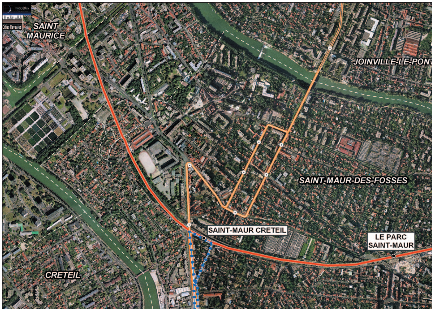
Vue aérienne de Saint-Maur-des-Fossés.

La liaison directe de Créteil à Noisy-le-Grand pourra être permise par des aménagements en faveur des bus sur l'avenue Charles Floquet à Joinville-le-Pont/Champigny-sur-Marne, ainsi que par la création d'un site propre sur les communes de Champigny-sur-Marne (avenue du Général De Gaulle), Bry-sur-Marne et Villiers-sur-Marne. Elle ne prévoit pas d'aménagement sur la commune de Saint-Maur-des-Fossés.